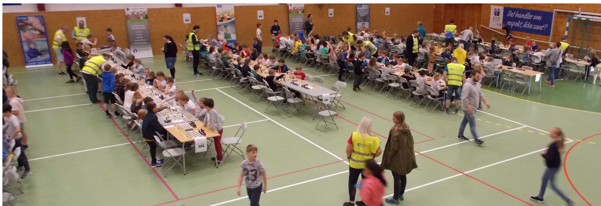
Fra Sjakkfestivalen i Dahlehallen 6. juni 2019

Opplegget og erfaringa gjør at det arrangementet går enklere og enklere. Dette året hadde vi veldig mange hjelpere med, og Sjakkklubbens medlemmer, og foreldre, stilte opp og gjorde en stor innsats.