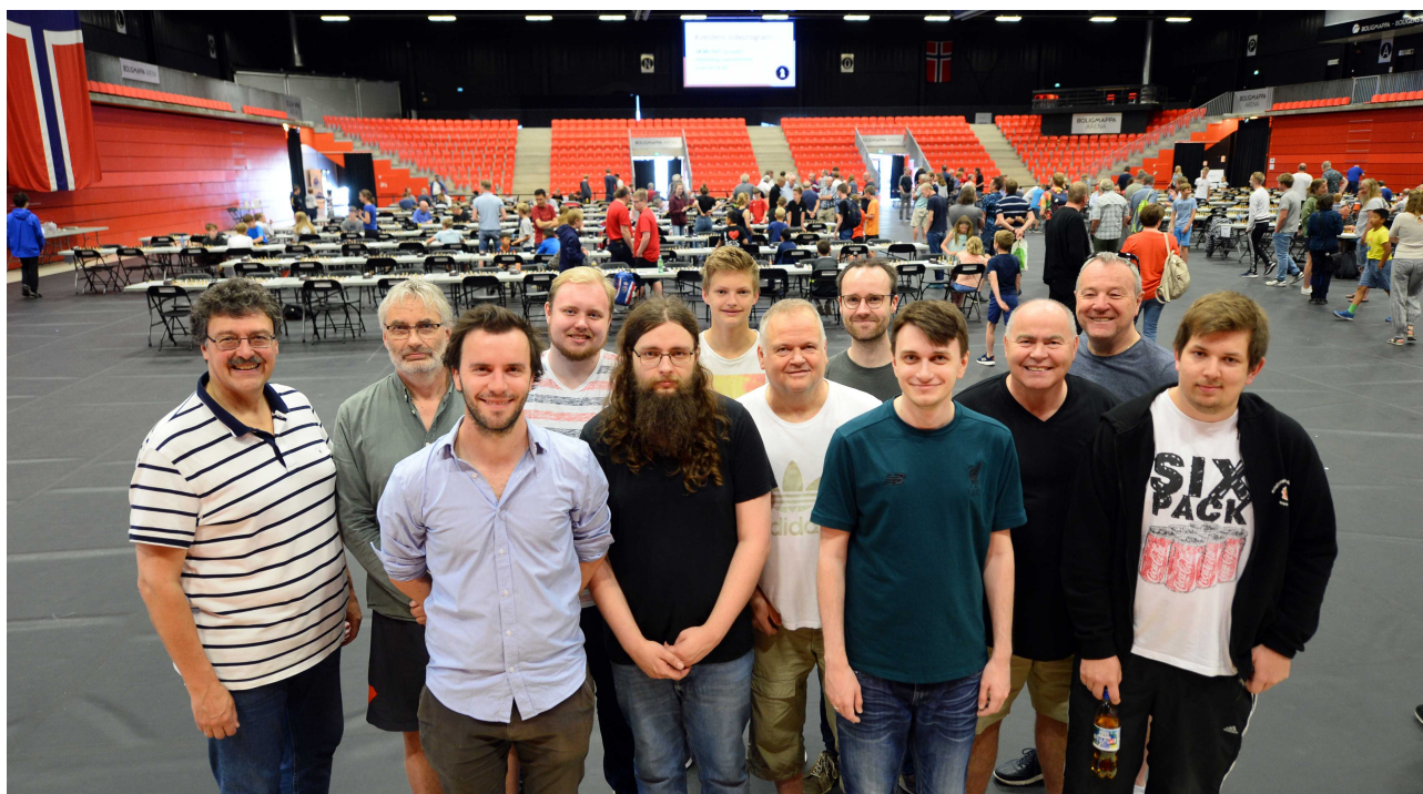
Fra Boligmappa Arena i Larvik med våre deltakere i Norgesmesterskapet 2019.

Det er det gode sosiale miljøet vi har i Landsturneringa og de ulike NM-ene som gjør at spillerne fortsatt vil være en del av gjengen.